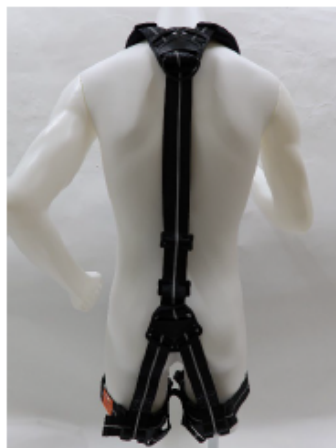
フルハーネス全体（後側）