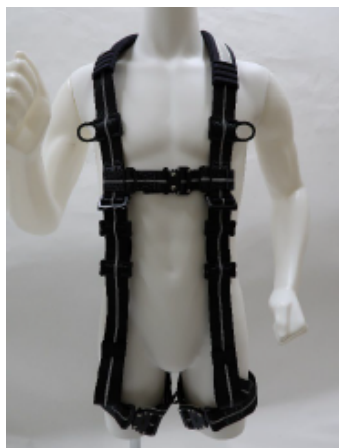
フルハーネス全体（前側）