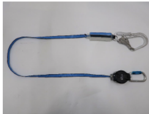
ランヤード全体 (巻取器からストラップを全て出した状態)